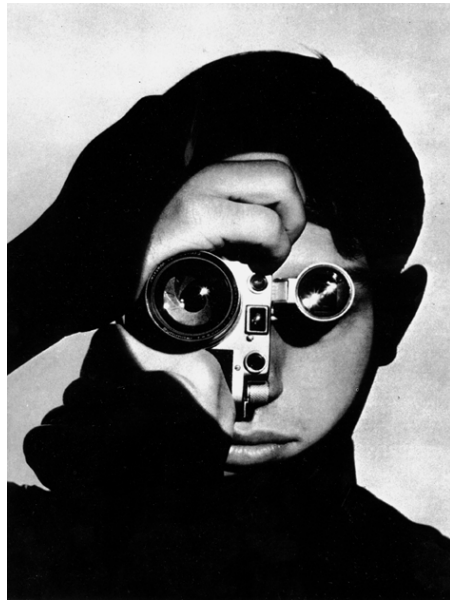
Das bewaffnete Auge. Andreas Feiningers berühmtes Bild Photojournalist 1955

Der Blick der Kamera erhält also seine „monstrative“ 7 Attitüde erst in Verbindung mit der Absicht dessen, der sie benutzt. Seine technischen Determinanten (Kadrierung, Kamerabewegungen, Teleskopeffekte, Schnitt etc.) treten angesichts der Intentionen ihrer Nutzung in den Hintergrund bzw. in deren Dienst. Die im engen Sinn Technisierung des Blicks ist in diesem Fall eher ein beiläufiger Aspekt, ungeachtet dessen, daß sie die Voraussetzungen bezeichnet für das Zustandekommen eventueller Erweiterungen des Begriffs im oben ausgeführten Sinn, die aber dann seine Verwendung eher ungenau, wenn nicht irreführend erscheinen lassen.